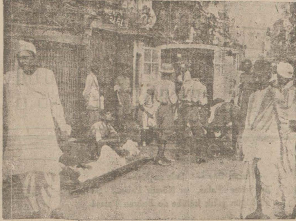
Hindistanda silâhsız itaatsizlik hareketi devam ediyor. Bombayda, Yine bu yüzden müsademeler olmuştur. Sahne, müsademe kurbanlarını derhal tedavi etmek için sokaklarda tesis edilmiş seyyar tedavihanelerden birini gösteriyor.

Vaşington, 28 — M. Hover kredilerin tevsine dair olan kanunu imzalamıştır.