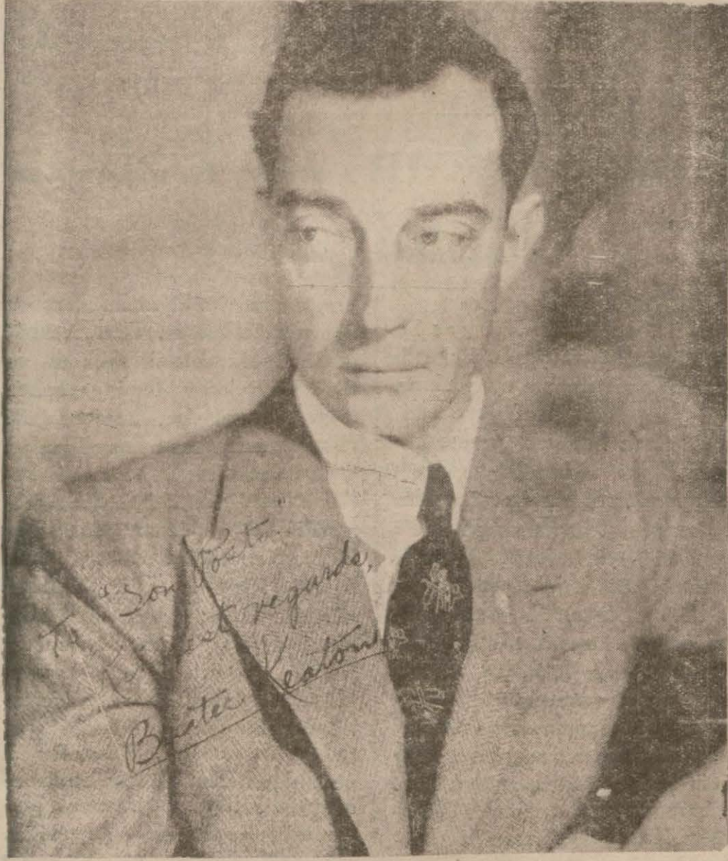
Buster Ketonun gazetemize hedige ettiği imzalı fotoğrafı

Sinemalarda bizi katilta katilta güldüren, bize hoş saatler geçiren komiklerin tiplerini hiç merak ettiniz mi? Amerikalı bir muharrir, komiklerin hepsini ayrı ayrı tetkik etmiş ve onların yaradılışları hakkında şayan dikkat hükümler vermiştir. Bu muharririn en çok beğendiği ve birinci sınıftan addettiği komikler yedi tanedir: