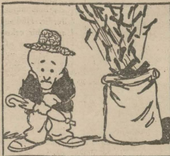
3: Hasan Bey — Kömür fırlamış, ortahıkta bir soğukluk başladı.