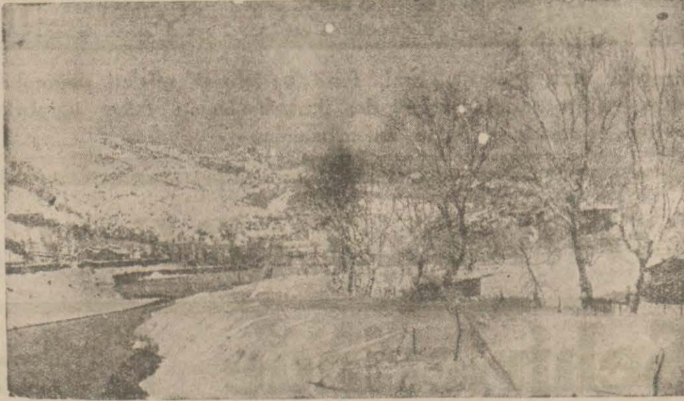
Kar yığınları altında zonguldak

Etin okkası 80 kuruştan aşağı düşüyor. Adi mağuş yağlar 200, beyaz peynir 150 kuruştur. Sebze fiyatları İstanbul piyasasile kıyas kabul etmeyecek kadar pahalıdır. Mesken ücretleri ise ateş pahasıdır. Gerçi Zonguldak belediyesi ihtikâra karşı çok sıkı tedbirler almıştır. Fakat tatbi-