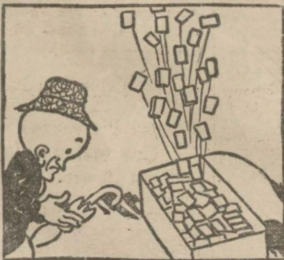
1: Hasan Bey — Şeker fırlamış, ortahıkta bir tatsızlık başladı.