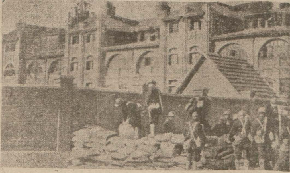
Uzak Şarktaki kanlı facia manzaralarından

Londra, 29 (D. Hususi) — Muh-telif Çin ve Ja-pon memba-larından gelen en son haberler, Aksayi Şarktaki vaziyetin gittikçe vahamet peyda ettiği hak-kında yeni taf-silât ile doludur. Şanghay cephe-sindeki vahim vaziyet, şimdi Şimalde Mançu-riye de sirayet etmiş bulunuyor. (Harbin) şehri civarında topla-nan iki Japon fırkası ile Çin askerleri arasında fili şekilde muharebe başlamıştır. Diğer taraftan Japonya'da müthiş bir sansör hüküm sürmektedir. O kadarki muharebe hakkındaki tafsilât et-