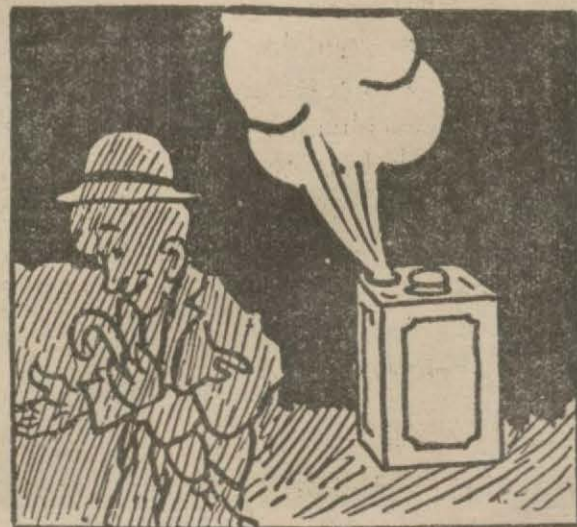
4: Hasan Bey — Gaz fırlamış, ortahıkta bir karanlık başladı. Karanlıkta, soğukta, yüzünü ekşit, tatsız tuzsuz yaşa bakalım!