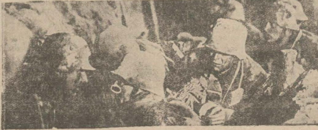
Almanlar. Habsburg hanedanı için bir haftadanberi siperlerde dövüşüyor, hudutlarda yatıyorlardı

— Aman yarabbî, kendisine böyle bir hareket nasıl isnat olunabilir? Fakat bu hususta Almanlar da bihakkin endişedirdiler: Müttefikleri şark harbine iştirak edecek mi? Almanya kendi kendine bu suali sormakla beraber bitaraf memleketlerde Avusturyalılar birlikte ve dirsek dirseğe olarak harbettiklerini işaa ederler.