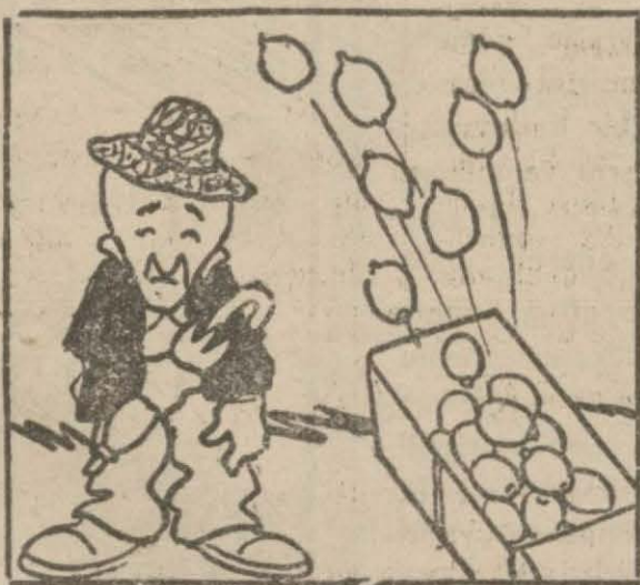
2: Hasan Bey — Limon fırladı, yüzlerde bir ekşilik başladı.